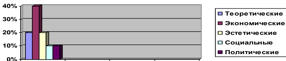
Рис. 1. Результаты констатирующего эксперимента

По результатам проведённого эксперимента мы выявили, что у многих учеников доминируют финансовые ценности – 40%. Теоретические и эстетические ценности расположились на втором месте, каждая из них набрала по 20%. На третьем месте расположились общественные и политические ценности – каждая по 10%. Для наглядности представляем диаграмму полученных результатов (см. рисунок 1).