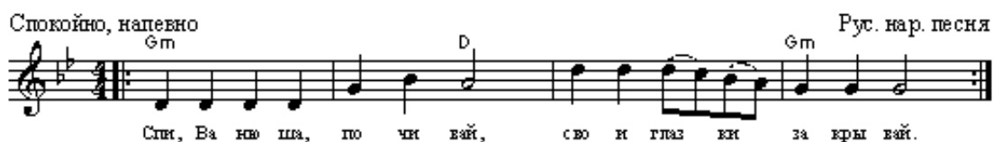
Рисунок 5. Русская народная колыбельная

Интерес к проблеме уходящих и забывающихся традиций побудил нас на проведение опроса среди мам школьников. Задачей было выяснить пели ли они своим детям наши исконно русские колыбельные песни. Многих опрошиваемых этот вопрос очень удивил, несколько мам вспомнили только современную песню « Спят усталые игрушки». Нас это очень удивило и заинтересовало. Поэтому на празднике Покрова наши девочки показали как укачивают кукол, которых сделали сами, и поют им народные колыбельные. Родители проявили огромный интерес к национальной культуре, что позволило нам с уверенностью и гордостью сказать, что наш спектакль прошел не зря.