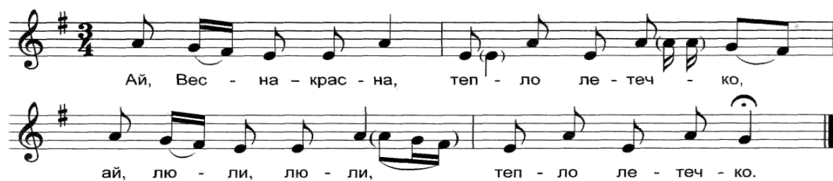
Рис. 2 Музыкальное сопровождение