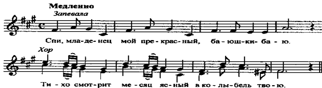
Рисунок 4. Колыбельная Казачья