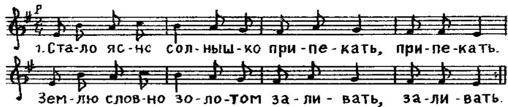
Рис.3 Музыкальное сопровождение