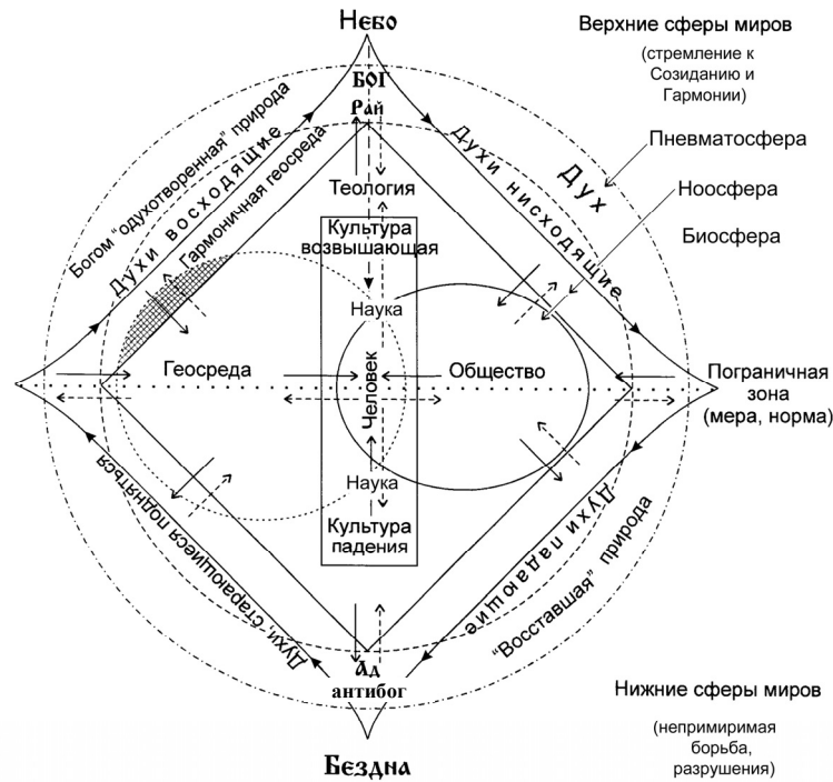
Рис. 5. Общая усложненная модель мира в системе «первопричина – дух/идея – природа – геосреда – человек – общество – культура – наука»

Отдельные проблемы, поднятые в этой небольшой статье, с той или иной степенью глубины уже неоднократно рассматривались богословами, философами, этнографами, культурологами, социологами, психологами, биологами и другими специалистами.